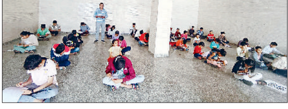
झज्जर। छात्रवृत्ति एवं दाखिला परीक्षा देते हुए विद्यार्थी।