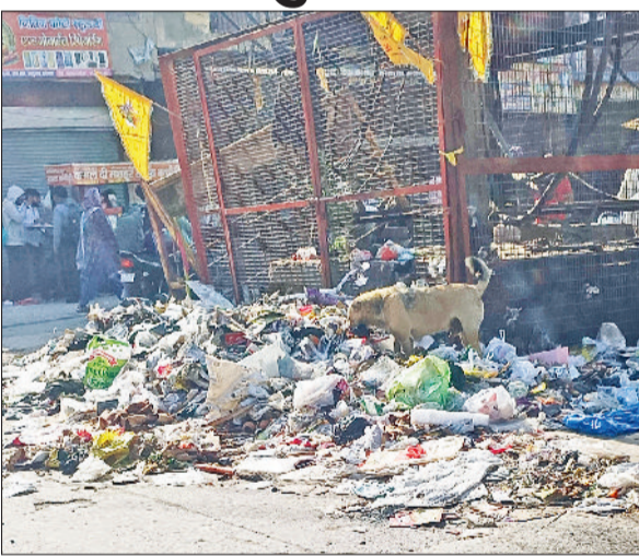
बहादुरगढ़। रविवार को गांधी चौक पर लगे गंदगी के ढेर।

वेतन न मिलने के विरोध में ठेके के अधीन कार्यरत सफाई कर्मचारियों द्वारा की गई दो दिवसीय हड़ताल थले ही समाप्त हो गई है, लेकिन शहर की सफाई व्यवस्था अभी पूरी तरह पटरी पर नहीं लौट पाई है। हड़ताल के कारण शहर के कई हिस्सों में गंदगी के ढेर सड़ रहे हैं, जिससे लोगों को परेशानी झेलनी पड़ रही है। दरअसल, शुक्रवार और शनिवार को सफाई कर्मचारियों ने वेतन भुगतान की मांग को लेकर कार्य बहिष्कार किया था। इस दौरान न तो नियमित सफाई हो सकी और न ही कचरे का उठान हो पाया। परिणामस्वरूप चौक-चौराहों और मुख्य मार्गों पर कचरे के ढेर लग गए। रविवार शाम को भी गांधी चौक और सुभाष चौक सहित कई अन्य