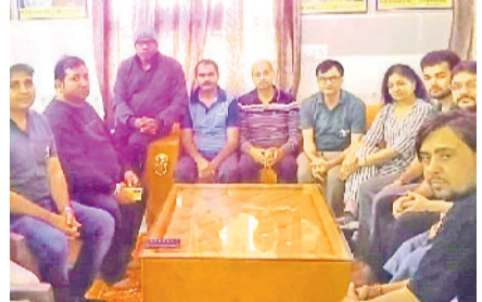
बहादुरगढ़। राशन सामग्री लेकर संस्थान में पहुंचे रॉबिन हुड आर्मी के सदस्य।