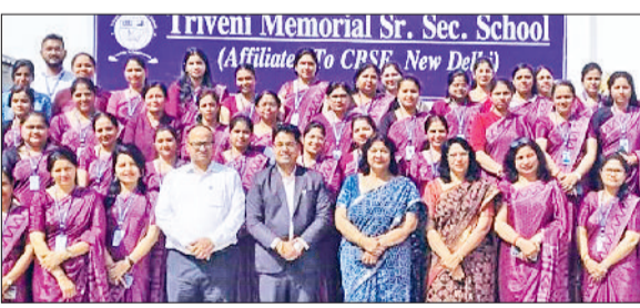
बहादुरगढ़। कार्यक्रम में मौजूद मुख्य अतिथि व स्कूल पदाधिकारी।