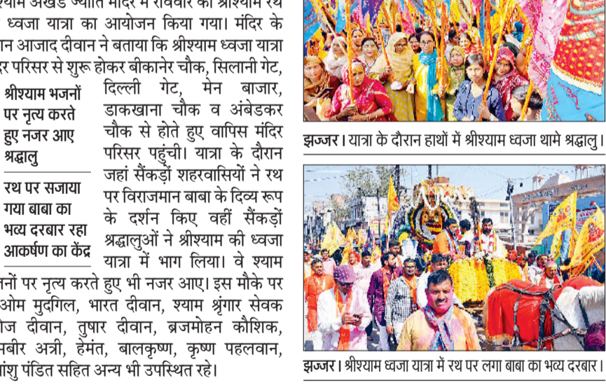
झज्जर। श्रीयाम ध्वजा यात्रा में रथ पर लगा बाबा का भव्य दरबार।