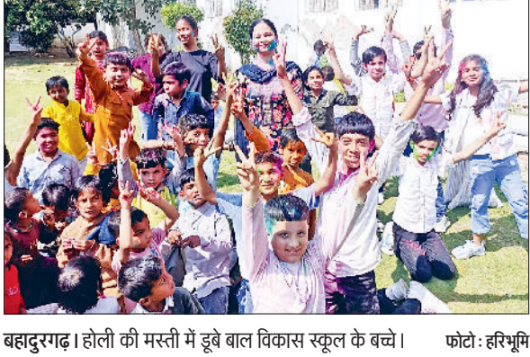
बहादुरगढ़। होली की मस्ती में डूबे बाल विकास स्कूल के बच्चे।