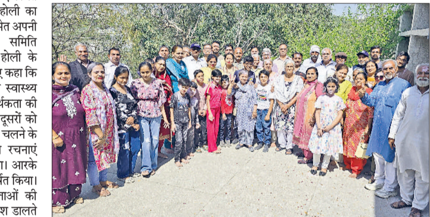
बहादुरगढ़। होली मिलन समारोह में उपस्थित सार्थक समिति सदस्य।