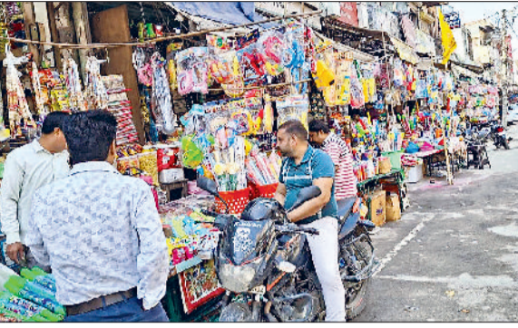
झज्जर। बस स्टैंड रोड पर सजी पिचकारियों की दुकान से खरीददारी करते हुए लोग।