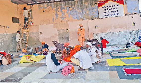
झंझर। श्री प्राचीन गोशाला में विश्राम करते हुए वार्षिकोत्सव में पहुंचे संत।