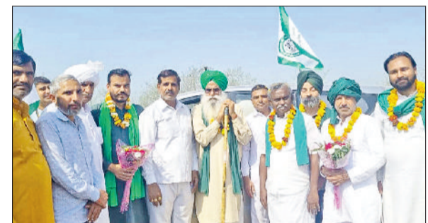
बहादुरगढ़। यात्रा के तहत केएमपी टोल पर पहुंचे एसकेएम के किसान नेता।

सात फरवरी को कन्याकुमारी से शुरू हुई थी और जम्मू कश्मीर तक जाएगी यात्रा