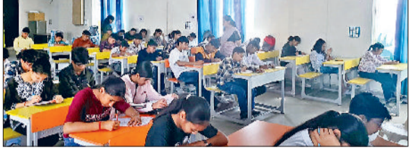
झज्जर। स्कॉलरशिप टेस्ट देते हुए विद्यार्थी।