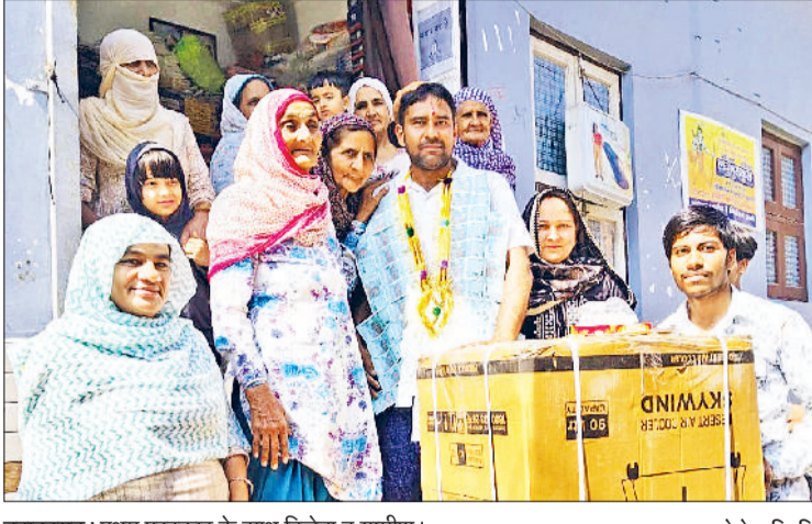
बहादुरगढ़। प्रथम पुरस्कार के साथ विजेता व ग्रामीण।

महिला, पुरुष, युवा और बुजुर्गों ने उत्साह के साथ भाग लेकर फिट रहने का संदेश दिया। महिला वर्ग की मटका दौड़ विशेष आकर्षण का केंद्र रही।