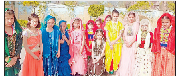
बहादुरगढ़। कार्यक्रम में भाग लेने वाले जूटिटर स्कूल के विद्यार्थी।