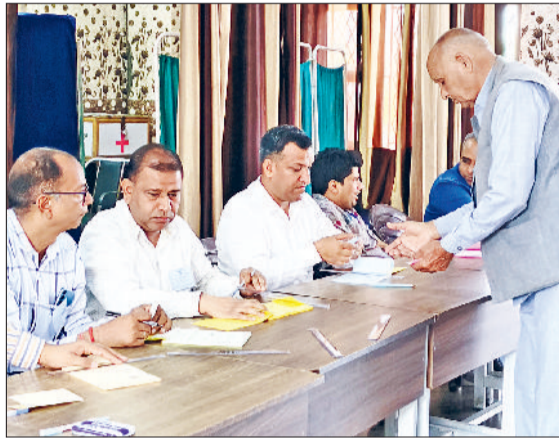
बहादुरगढ़। मतदान के दौरान बलेट हासिल करते सोसायटी सदस्य।