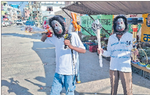
झज्जर। बीकानेर चौक पर मुखौटे लगाकर हथियारनुमा पिचकारी दिखाते युवा।